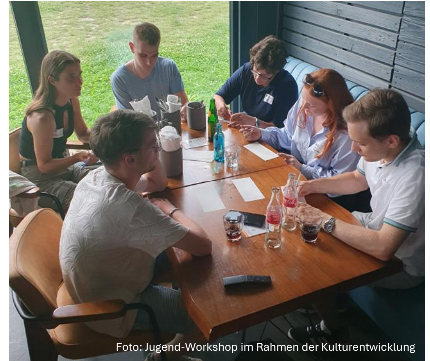
Foto: Jugend-Workshop im Rahmen der Kulturentwicklung